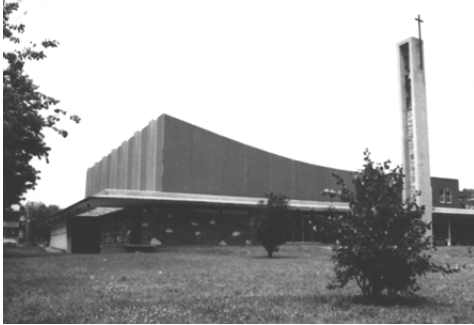
L'ÉGLISE SAINT-BERNARD, VUE DE LA RUE NOTRE-DAME, PEU DE TEMPS APRÈS SA CONSTRUCTION EN 1966.