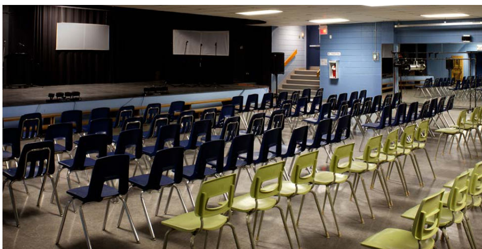
AU SOUS-SOL, DES SALLES SONT ADAPTÉES POUR DES ACTIVITÉS SCOLAIRES PLUS SPÉCIALISÉES.

a été conservée, assurant le maintien d'un éclairage naturel. Diverses interventions de mise aux normes ont été nécessaires, tant au niveau de la ventilation que de la sécurité incendie. Des panneaux acoustiques ont été intégrés aux parois de la nef. L'ancienne sacristie a été transformée en vestiaires. Au sous-sol, deux salles polyvalentes sont utilisées pour la danse, les arts dramatiques et le conditionnement physique. De plus petites superficies sont adaptées pour des activités scolaires plus spécialisées, ainsi que pour des vestiaires et des espaces de rangement.