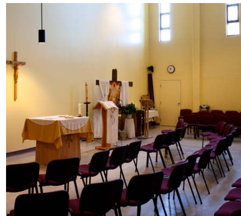
LE MAINTIEN DE LA CHAPELLE ASSURE UNE TRANSITION SYMBOLIQUE AVEC L'ÉTAT D'ORIGINE.