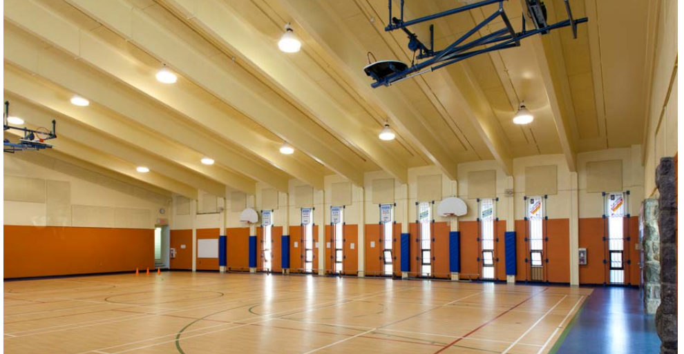
CE TYPE D'ÉGLISE MODERNE OFFRE UN POTENTIEL DE RECYCLAGE PLUS GRAND.

Le collège Mont-Royal est implanté dans le secteur Mercier depuis 1973. Son développement immobilier est toutefois rendu difficile en raison de son enclavement dans un quartier résidentiel. Si des ententes d'utilisation de plateaux sportifs et autres équipements spécialisés dans le quartier et à Montréal-Est avaient permis de maintenir une bonne diversité d'activités pour les élèves, des problèmes de transport et de coûts avaient incité le Collège à étudier, en collaboration avec la Ville de Montréal, la possibilité d'aménager des locaux plus proches dès 1994. Lorsque l'annonce de la vente de l'église Saint-Bernard est faite en 2003, le Collège manifeste rapidement son intérêt et entame des négociations avec le diocèse de Montréal. Ce dernier ne souhaite pas vendre l'édifice à un promoteur privé, favorisant la conclusion de la vente au Collège pour un montant de 720 000 $. La consultation des citoyens du quartier permet