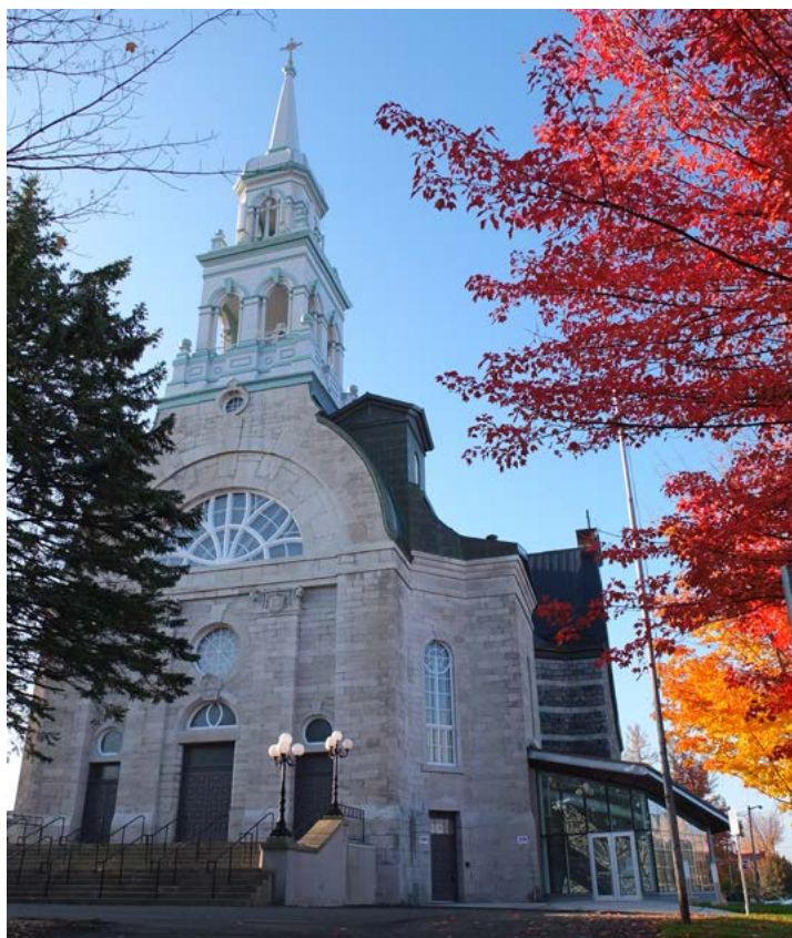
Église Notre-Dame Granby Montérégie

Pôle du savoir et lieu d'échanges au cœur de la ville