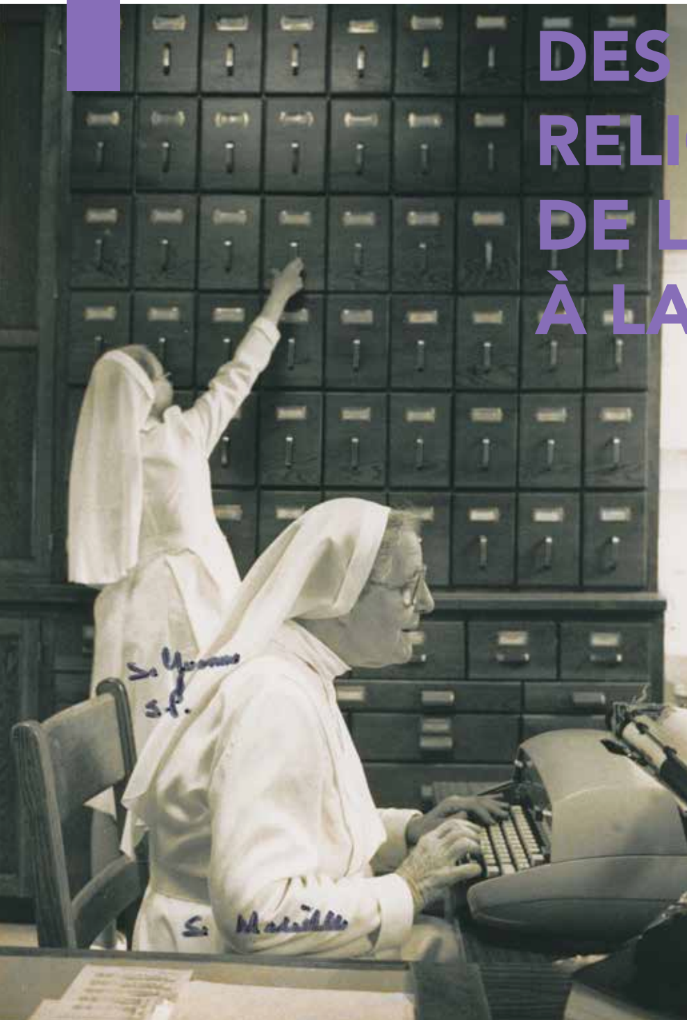
Augustines archivistes, 1991, Lévis, Le Monastère des Augustines, HDL-L1-M1,3/4 :4.

Journée des Archives DU CONSEIL DU PATRIMOINE RELIGIEUX DU QUÉBEC