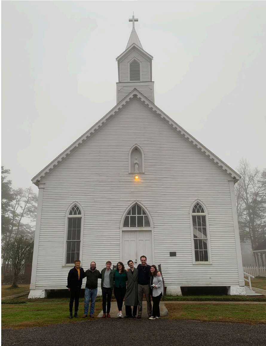
Visite de l'église Saint-François de Pointe Coupée