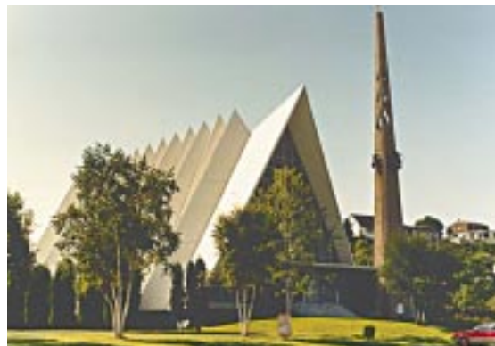
Église Saint-Marc, La Baie