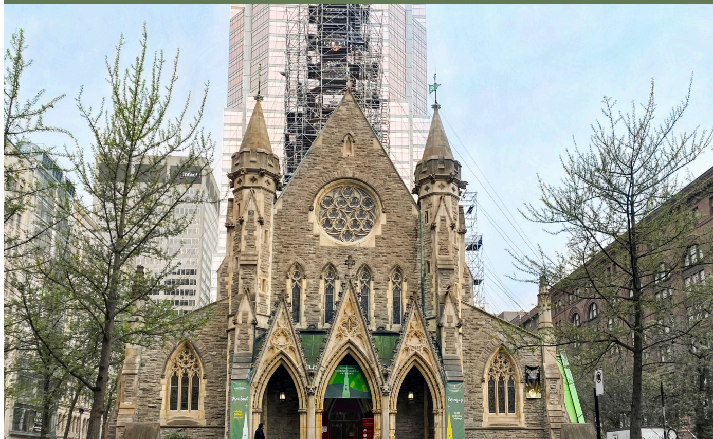
La cathédrale Christ Church, en chantier de restauration pour son clocher.

La Fiducie nationale du Canada a annoncé les 9 lauréats des Prix des gouverneurs 2022.